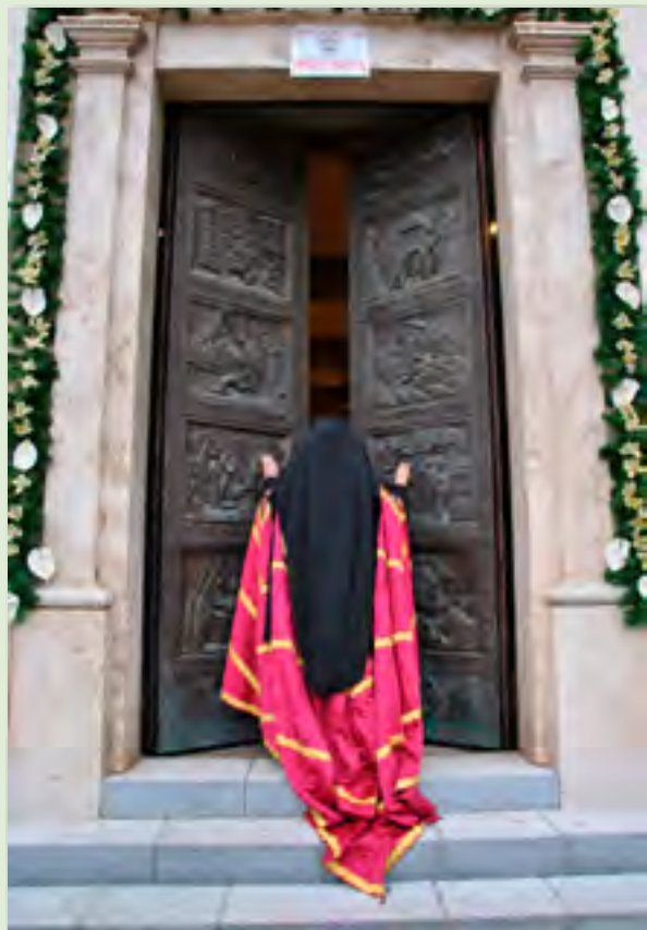
Lungro, 12 dicembre 2015