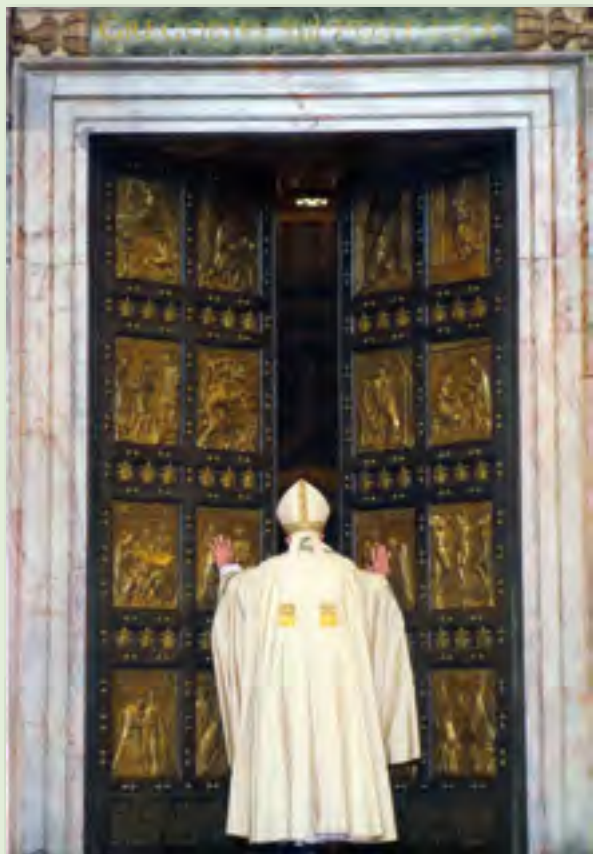
Roma, 8 dicembre 2015